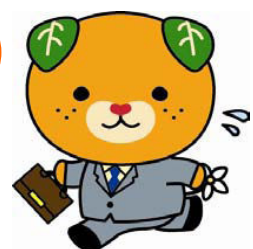
愛媛県イメージアップキャラクター 「みきゃん」